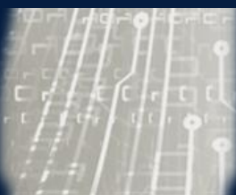
DATA, COMPUTING & DIGITAL