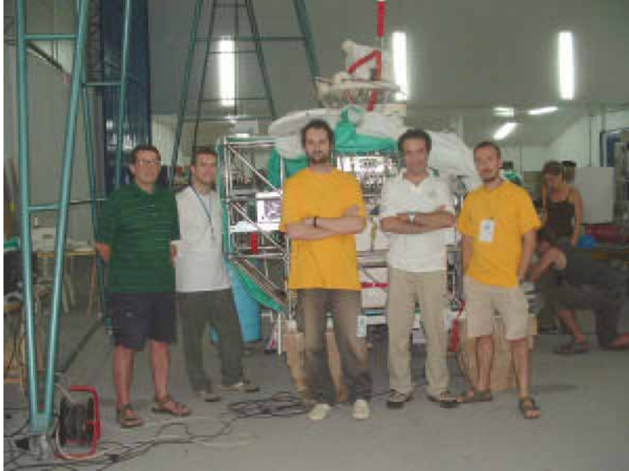
Figura 4: Team REFIR-PAD del CNR

banda rotazionale del vapor d'acqua e le nubi danno nel lontano IR all'effetto serra. Il lavoro, di grande interesse per la ricerca climatologica, è studiato nell'ambito di collaborazioni nazionali (IMAA-CNR, ADGB-Univ. di Bologna, DIFA-Univ. della Basilicata) che internazionali (Imperial College-Londra, Agenzia Spaziali: francese - CNES, europea - ESA, statunitense - NASA).