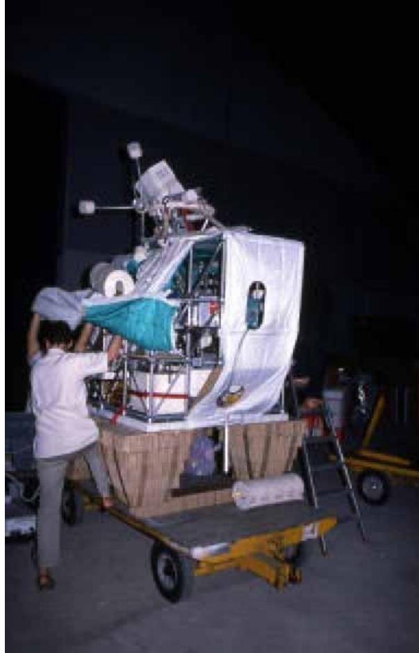
Figura 3: Navicella LPMAA-CNES durante la preparazione del lancio.

le tecnologie richieste (con eccezione dei rivelatori piroelettrici) per ottenere uno strumento compatto per applicazioni sia di laboratorio che sul campo.