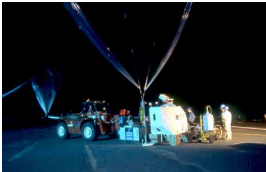
Figura 1: Lancio di REFIR-PAD dalla base di lancio palloni stratosferici situata presso Teresina, Brasile, 30 giugno 2005, 3:36 locali.

Il 30 giugno 2005, è stato effettuato con successo il volo su pallone dello spettrometro a trasformata di Fourier REFIR-PAD (Radiation Explorer in the Far InfraRed - Prototype for Applications and Development), realizzato presso l'Istituto di Fisica Applicata "Nello Carrara" (IFAC-CNR). Il lancio è avvenuto dalla base di Teresina in Brasile (Figura 1). Lo strumento ha eseguito la misura della radiazione emessa dall'atmosfera verso lo spazio coprendo per la prima volta tutta la regione spettrale coinvolta in questo fenomeno. I dati raccolti forniscono informazioni dettagliate sui principali componenti dell'atmosfera che determinano l'effetto serra e più in generale i cambiamenti climatici.