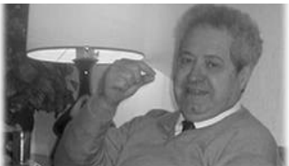
Antonio Zampolli, fondatore dell'ILC

Svolge attività di ricerca in settori scientifici strategici della disciplina, nonché attività editoriali, di valorizzazione e trasferimento tecnologico e di formazione.