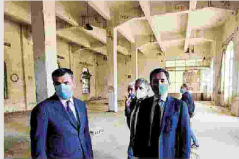
NEL CANTIERE Entro Natale i lavori per quella che sarà la sede del Cnr nell'ex Manifattura tabacchi

Nella Manifattura del futuro la sede barese del Centro ricerche