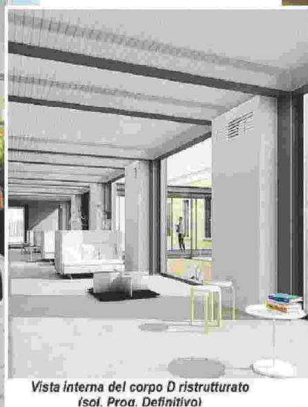
Vista interna del corpo D ristrutturato (sol. Proa. Definitivo)