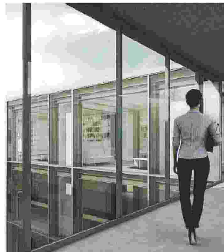
Ponte di collegamento al corpo D (sol. Prog. Definitivo)