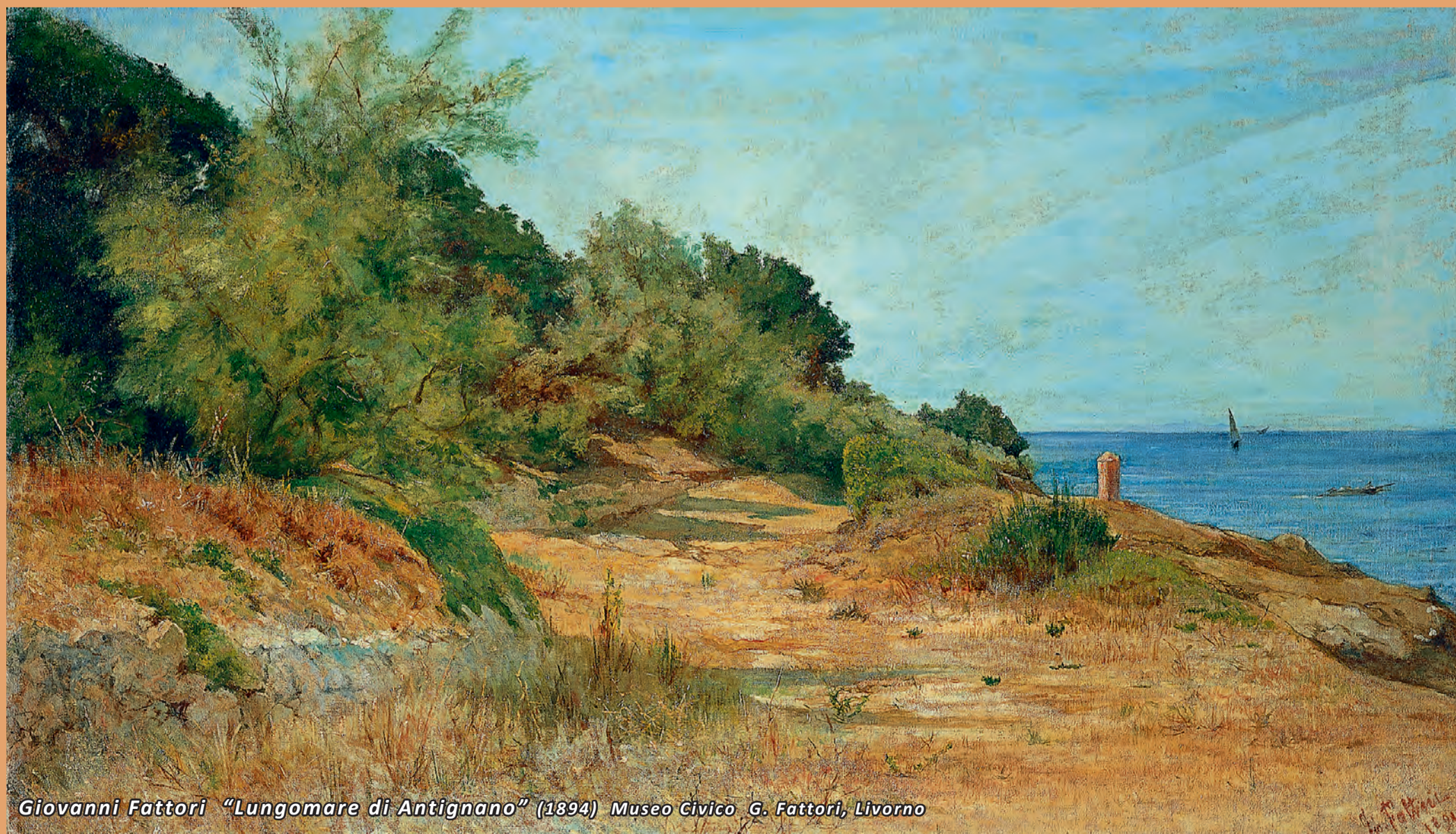
Giovanni Fattori "Lungomare di Antignano" (1894) Museo Civico G. Fattori, Livorno